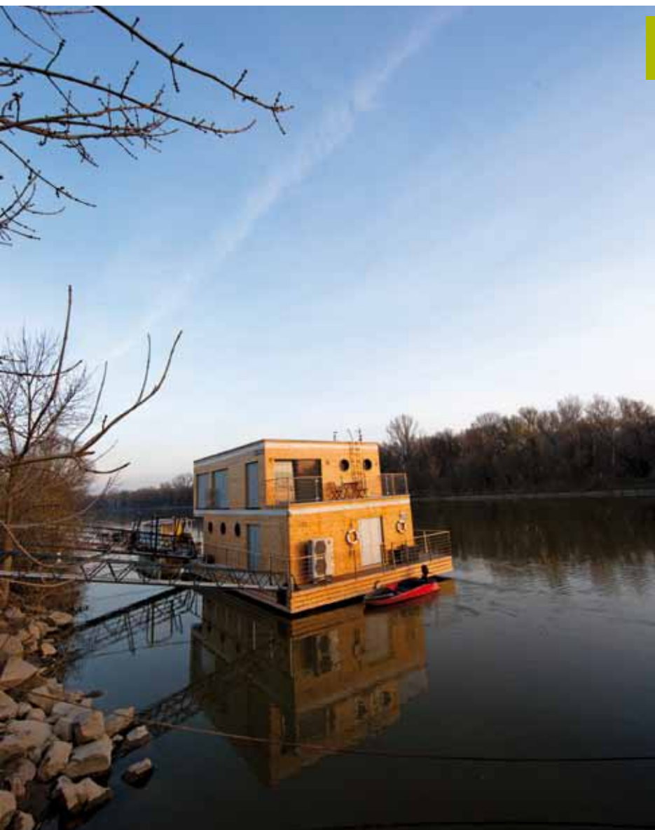
Kotviště domu na okraji přírodní rezervace a deset minut od centra Komárna, Slovensko, 2010

Bydlení na vodě nemusí znamenat stísněné prostory, interiér domu v Komárně