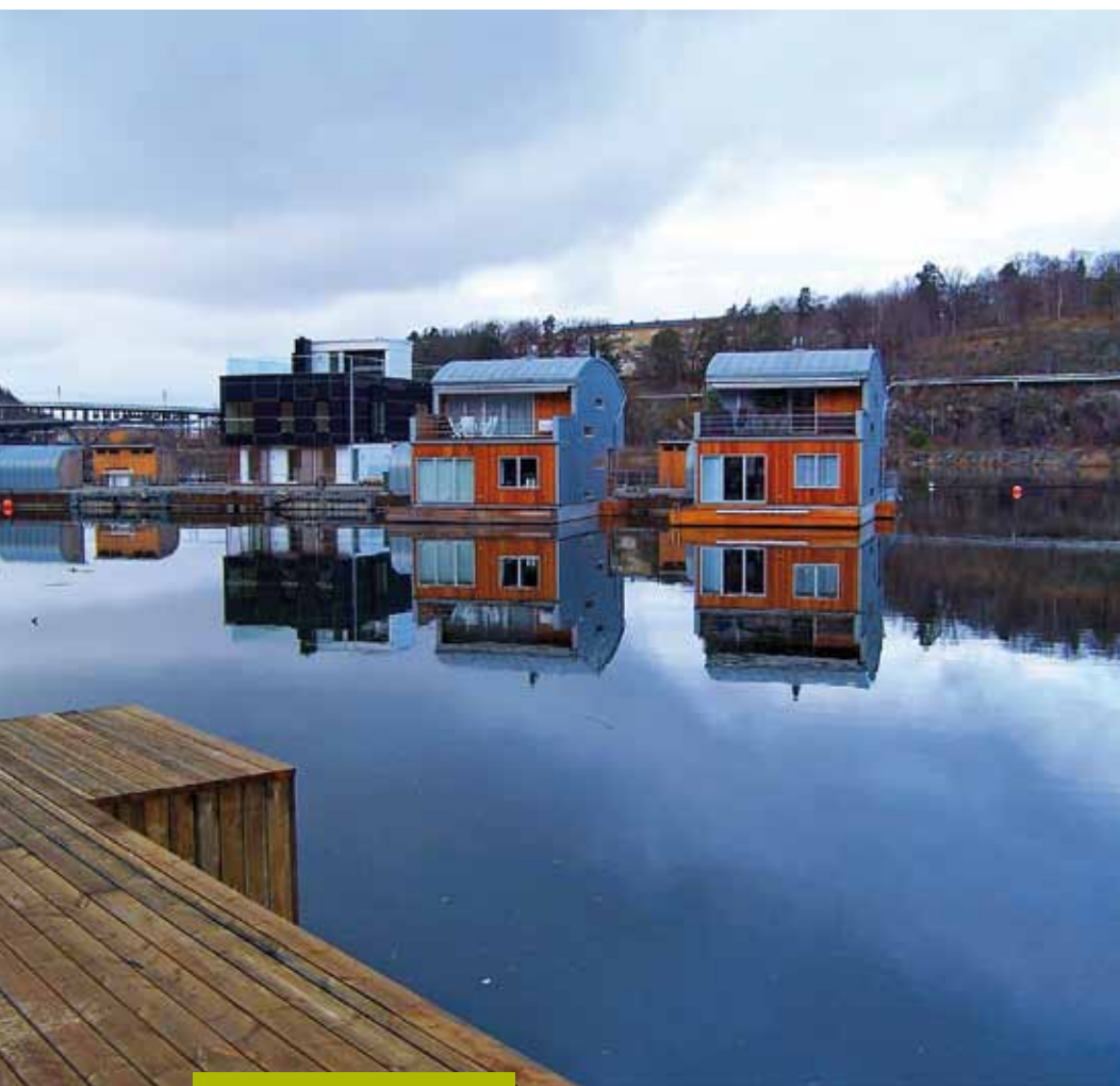
Plovoucí vesnička Marinstaden ve Stockholmu, Švédsko, 2006–2010