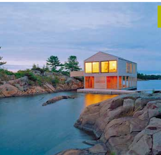
Chata na jezeře Huron, Kanada, 2005